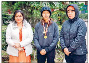
जीद। पदक विजेता छात्रा के साथ प्राचार्या।