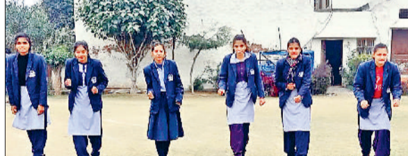
जीद। एनएसएस शिविर के दौरान दौड़ प्रतियोगिता में भाग लेते छात्राएं।