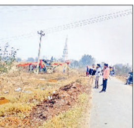
अलेवा। बधाना गांव में ट्रैक्टर की सहायता से पंचायती जमीन पर कब्जा लेता जिला प्रशासनिक अमला।