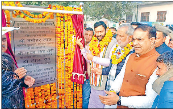
कैथल। सांसद नायब सिंह सैनी ने किया क्योडक के कोटिकुट के सौंदर्यकरण का शिलान्यास करते हुए तथा सांसद नायब सिंह सैनी को सम्मानित करते पदाधिकारी।