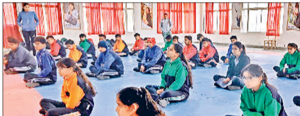
जीद। शिविर में भाग लेते हुए छात्राएं।