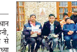
जीद। कार्यक्रम में मौजूद अतिथि व श्रद्धालुगण।