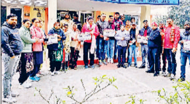
जीद। ओपीएस महारैली को लेकर कर्मचारियों के साथ बैठक करते हुए कर्मचारी नेता।