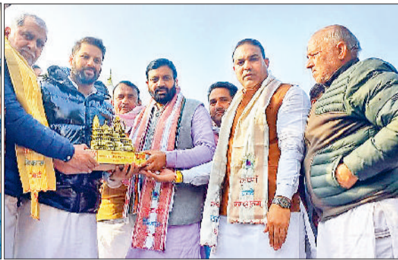
कैथल। सांसद नायब सिंह सैनी ने किया क्योडक के कोटिकुट के सौंदर्यकरण का शिलान्यास करते हुए तथा सांसद नायब सिंह सैनी को सम्मानित करते पदाधिकारी।

हरियाणा में आज एक अलग ही माहौल है। गरीबों को उनका हक दिलवाया जा रहा है। केंद्र और राज्य सरकार केवल बात करने वाली नहीं बल्कि काम करने वाली सरकार है जो कि संबंधित व्यक्तित्व को योजनाओं का लाभ सीधा पहुंचा रही है। आज देश के प्रधानमंत्री नरेंद्र मोदी व प्रदेश के मुख्यमंत्री मनोहर लाल के कुशल नेतृत्व में दिन-रात तरक्की के नए आयाम स्थापित कर रहा है। क्योडक व बलवंती के तीर्थ के विकास में और गति तेज होगी। पहले तीर्थों की हालत