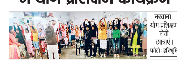
नरवाना। योग प्रशिक्षण तैारी छात्राएं।